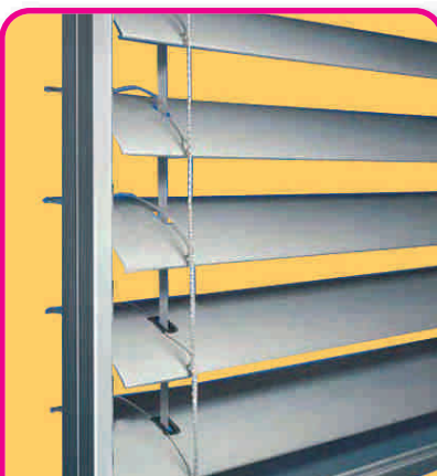
lames galbées de 80 mm