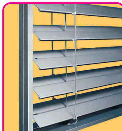
lames brisées de 88 mm

La lame galbée de 80 mm permet d'obtenir une pénombre prononcée (effet « vénitien ») lorsque le store est fermé.